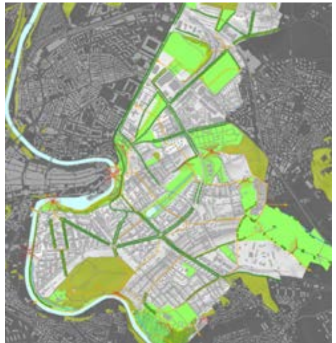
Landschafts- und Naturraumkonzept (gemäss Quartierplan 2012 im Stadtteil 4)

Die Stadt Bern hat sich zur Velohauptstadt und zur Förderung des Veloverkehrs bekannt. Die Symbolik der Alleen markiert aber bis heute weitgehend nur Autostrassen. Hier braucht es eine Fokus-Verschiebung: Das Velo ist das Verkehrsmittel der Zukunft. Deshalb sollen Alleen zukünftig die wich-